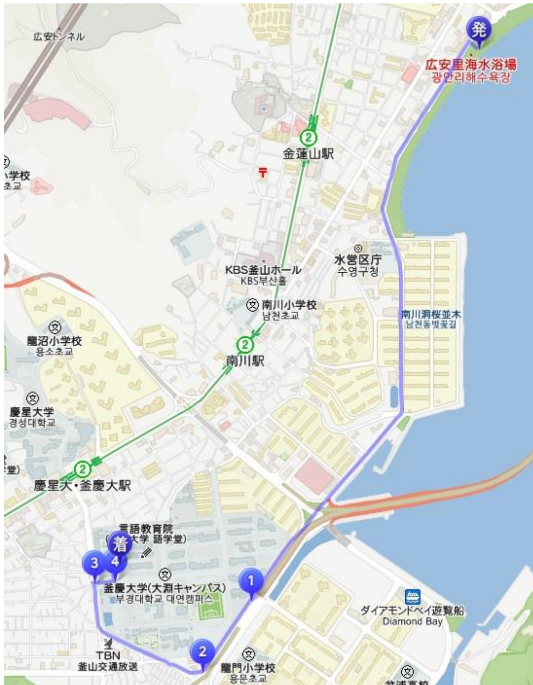
図5 廣安里から大学までのタクシー経路

距離：3.82km 料金：4,300W 時間：(車)9分 (これとは限りません)