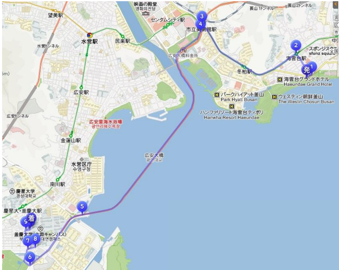
図 6 海雲台から大学までのタクシー経路

距離：10.53km 料金：9,100W 時間：(車)24分 (これとは限りません)