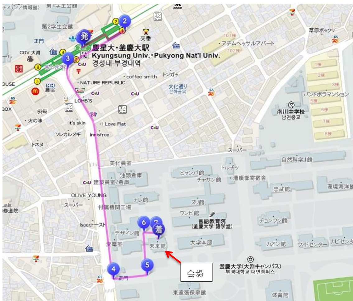
図2 大学近くの地図

大学近くの地図を図2に示します。デヨンキャンパスは地下鉄駅から歩いて15分弱です。玄関の場所は不明です。