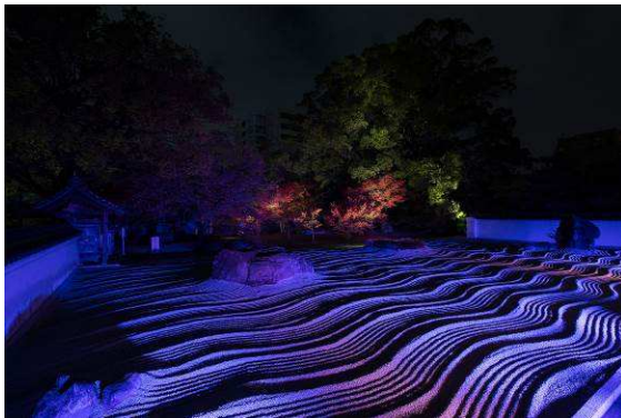
図3 承天寺・洗滯庭