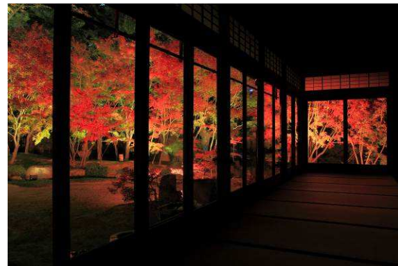
図4 承天寺・泉水庭