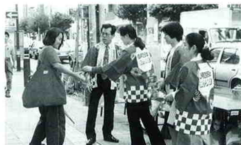
那覇市・沖縄三越前（沖縄地区）