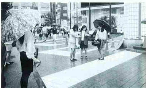
東京・有楽町 有楽町電気ビル前（東京地区）