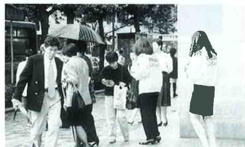
福岡市 天神ビル前（九州地区）