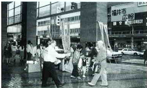
福井市・だるまや西武前（山陰地区）