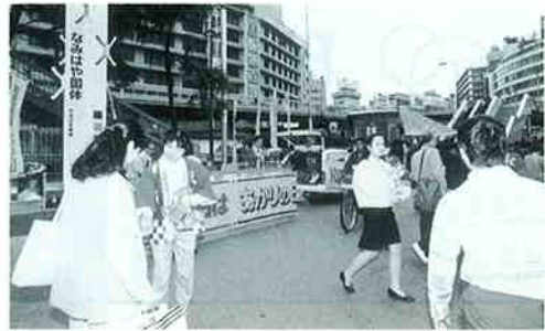
大阪市・大阪駅前（関西地区）