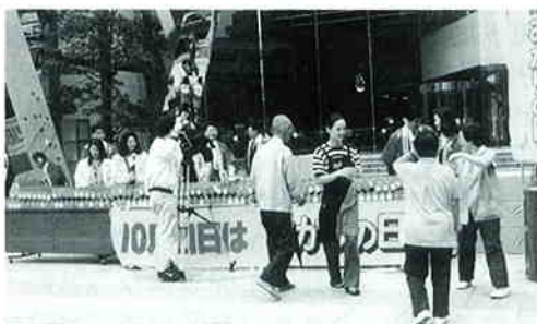
名古屋市栄 電気文化会館前（東海地区）