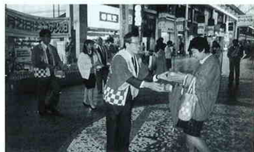
高松市 三越YOU前（四国地区）