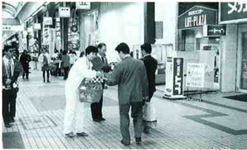
札幌市・狸小路通商店街（北海道地区）