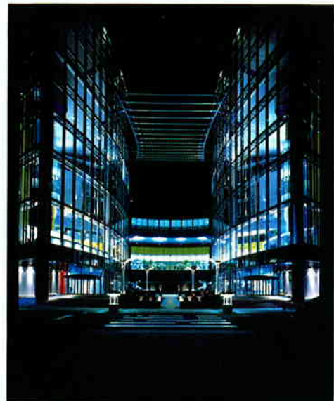
コスモゲートアトリウム