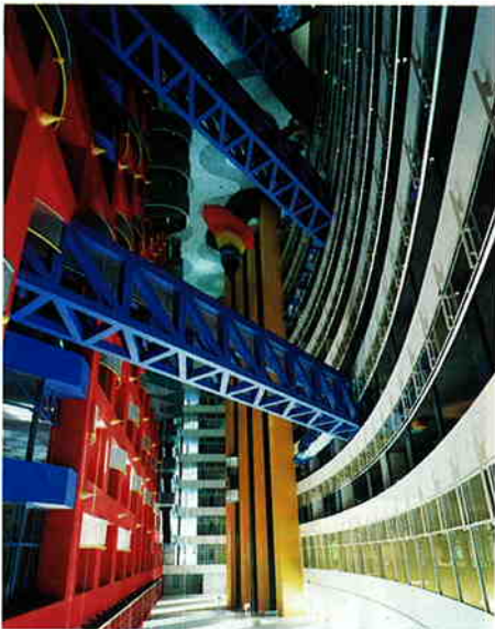
セントラルアトリウム