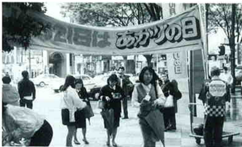
仙台市・藤崎デパート前（東北地区）