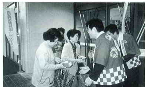
松江市・ショッピングセンターサティ前（中国地区）