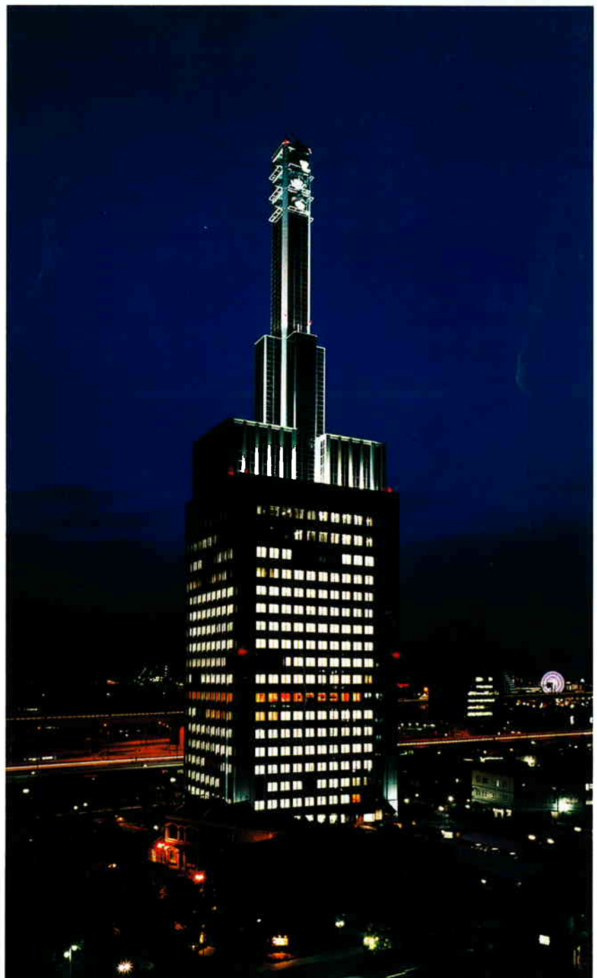
▲メタルハライドランプ(夏用)