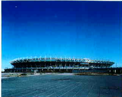
▲全景 スタジアム内▶