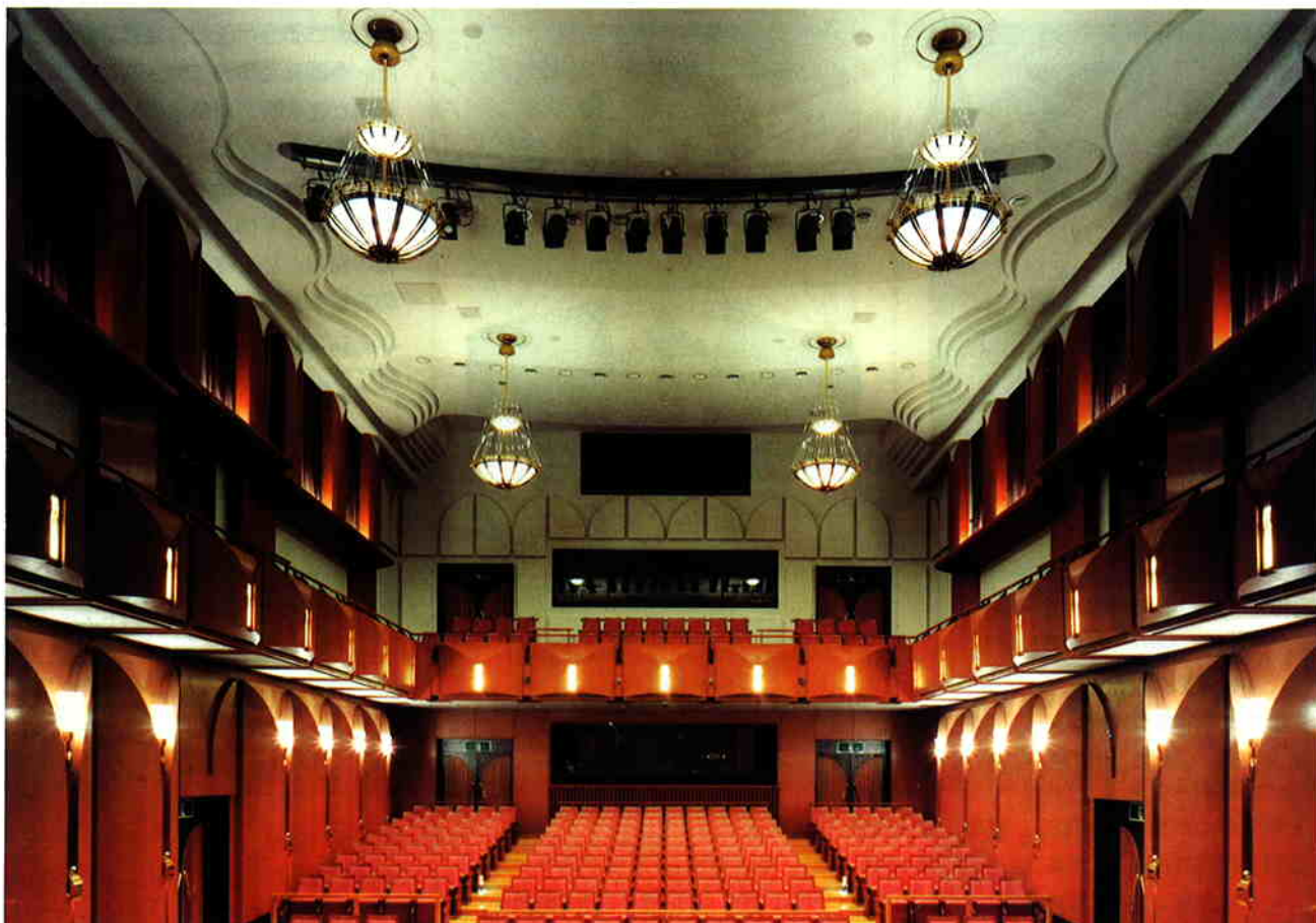
▲ 盛岡市民文化ホール コンサートホール(小ホール)

匠のモチーフは、音楽ホールなので楽器、岩手県花の lindow、そして地場産業である鉄鋳物といった産物をそれぞれ形や素材に表現されている。