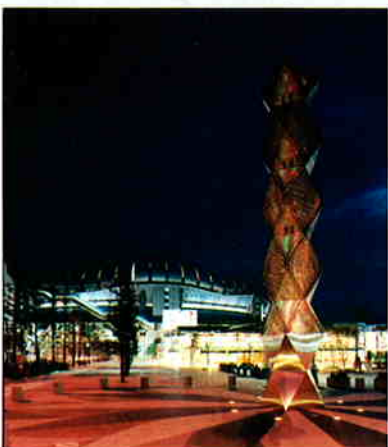
▲光のモニュメント