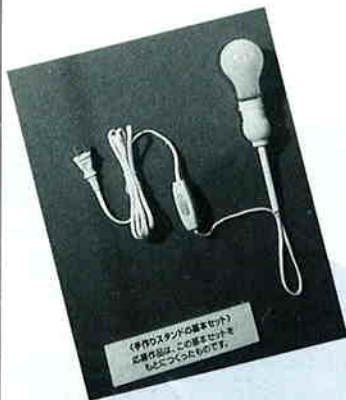
▲手作りスタンドコンテスト基本セット(抽選で500名)