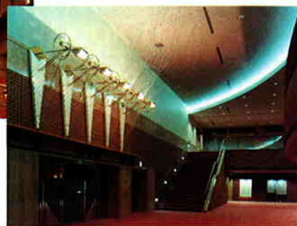
▼ ホワイエ(大ホール)

匠のモチーフは、音楽ホールなので楽器、岩手県花の lindow、そして地場産業である鉄鋳物といった産物をそれぞれ形や素材に表現されている。