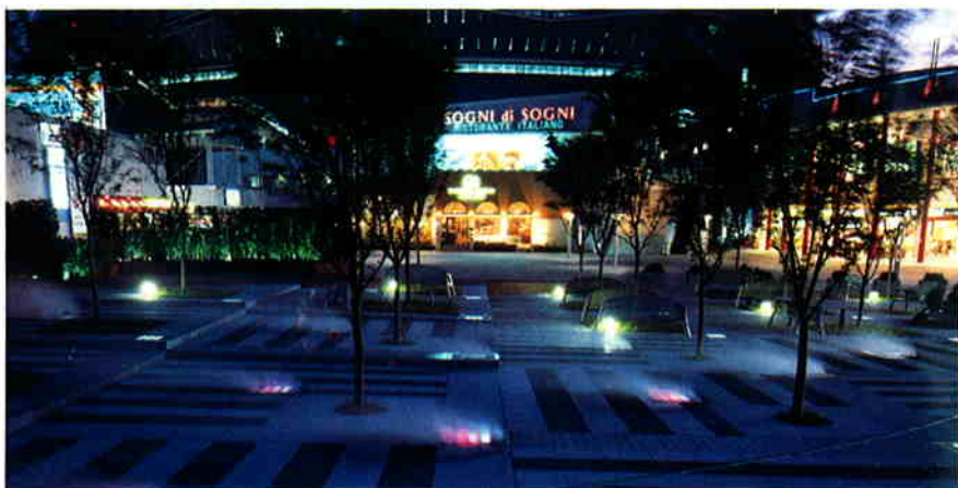
▲霧・樹木・ガラスブロック用照明