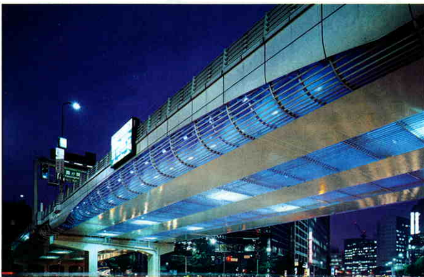
▲夜景・光源：メタルハライドランプ150W(ブルーフィルター付)