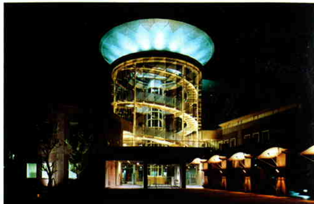
▲光源：2光色発光形HIDランプ(水銀ランプ)