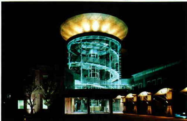
▲光源：2光色発光形HIDランプ(ナトリウムランプ)