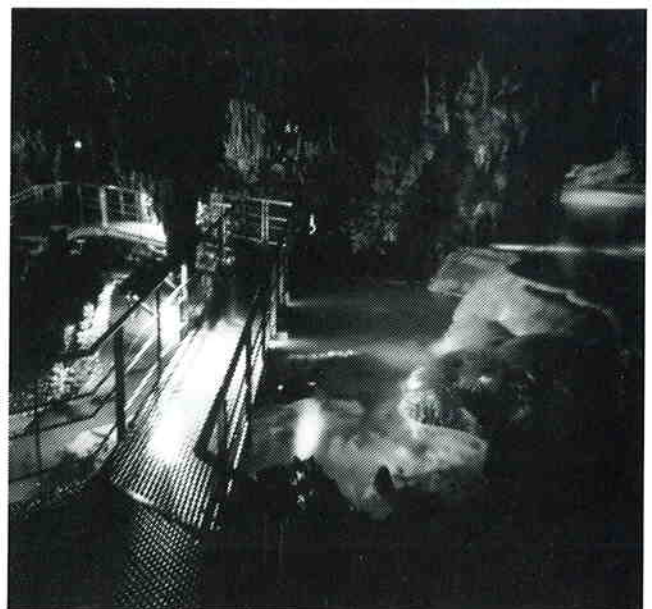
上段 三井アーバンホテル (秋田県)